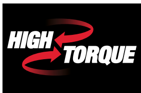
Logo HIGH TORQUE marki Shindaiwa.

Jest to nowoczesna technologia konstrukcji przekładni mająca za zadanie optymalizację wydajności silnika. Dzięki temu idealnie wspomaga pracę w bardzo trudnych warunkach. Cięcie nawet gęstych zarośli przy użyciu głowicy żyłkowej staje się przyjemną pracą. Seria HIGH TORQUE występuje w kosach marki SHINDAIWA oraz ECHO.